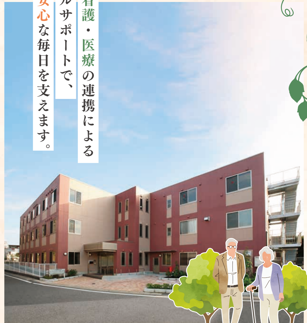
UNOTRE MAISON KASHIWA

介護・看護・医療の連携による トータルサポートで、 自由で安心な毎日を支えます。